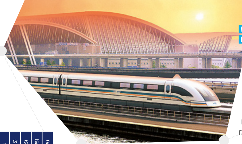
Magnetschwebebahn Pudong (Shanghai)

Chinesisch-Deutschen Technischen Fakultät (CDTF) in Qingdao verfassen sie ihre Studienarbeiten und bauen ihre chinesischen Sprachkenntnisse aus. Parallel dazu bereiten sie in deutschsprachigen Tutorien chinesische Kommilitonen auf deren Weiterstudium in Deutschland vor.