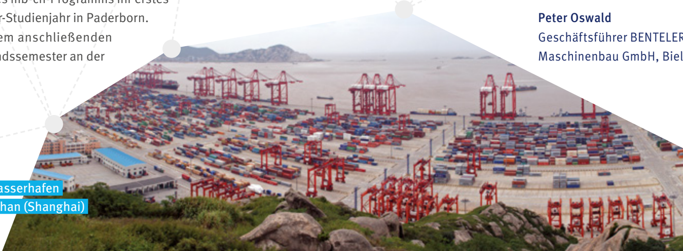
Tiefwasserhafen Yangshan (Shanghai)

Ihre Masterarbeit sollen die Teilnehmer im Abschlussemester in einem deutschen Unternehmen in China schreiben. Ein erfolgreicher Studienabschluss umfasst das Master-Zeugnis der Universität Paderborn und ein ergänzendes Diploma Supplement der CDTF, das die im Ausland erbrachten Studienleistungen benennt.