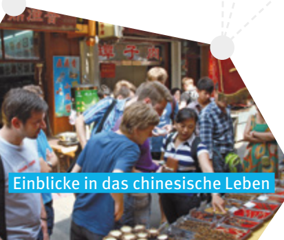
Einblicke in das chinesische Leben